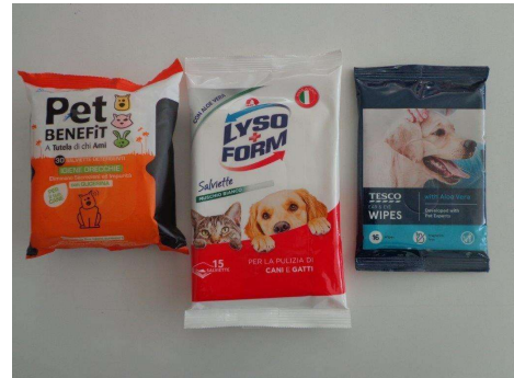
Immagine prodotti della concorrenza