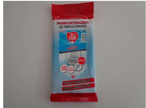
Immagine prodotti della concorrenza