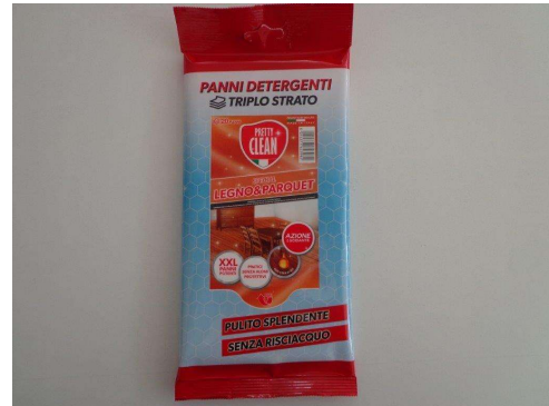
Immagine prodotti della concorrenza