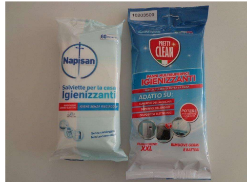
Immagine prodotti della concorrenza