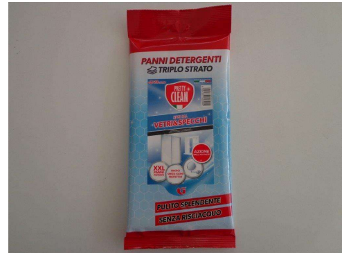
Immagine prodotti della concorrenza