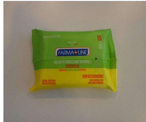
Immagine prodotti della concorrenza

Wet Wipes profumante per il Corpo umano con olii essenziali citronella- geraniolo- citronello