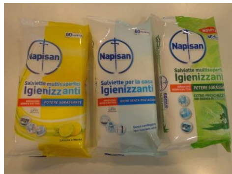
Immagine prodotti della concorrenza